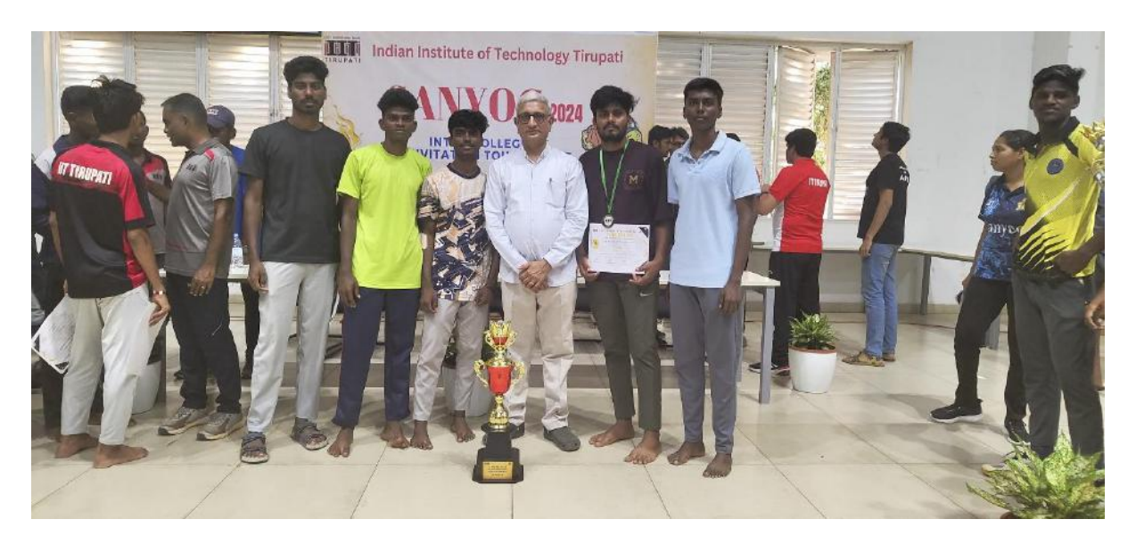
MITS BASKETBALL JNTUA INTER UNIVERSITY REPRESENTATIVES