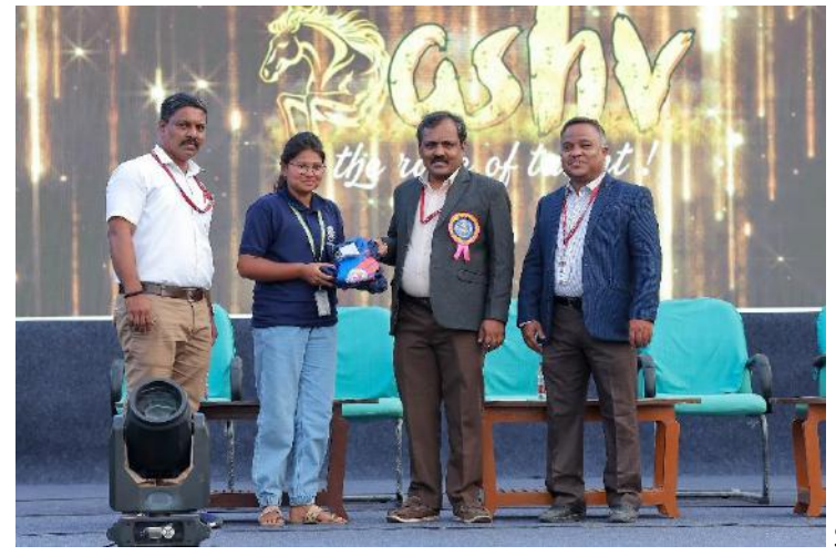
SPORTS COORDINATOR OVERALL